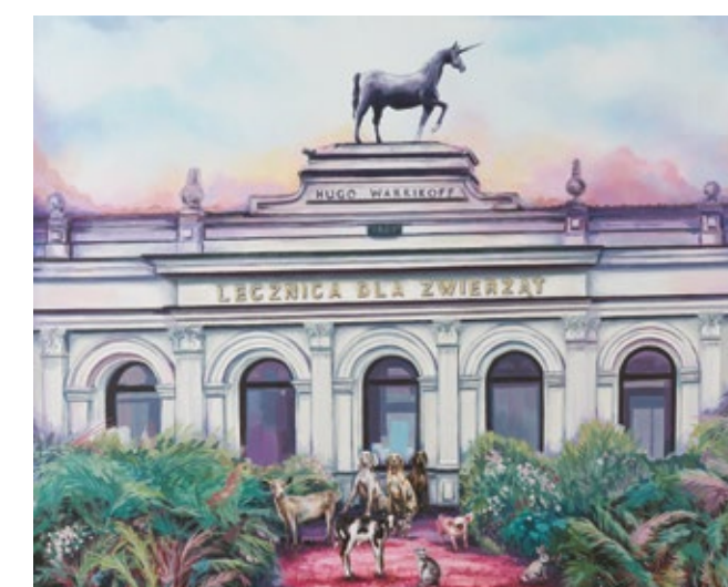
Sierpień Roksana Karczevska High hopes - akryl, płótno / płyta, 65x80 cm