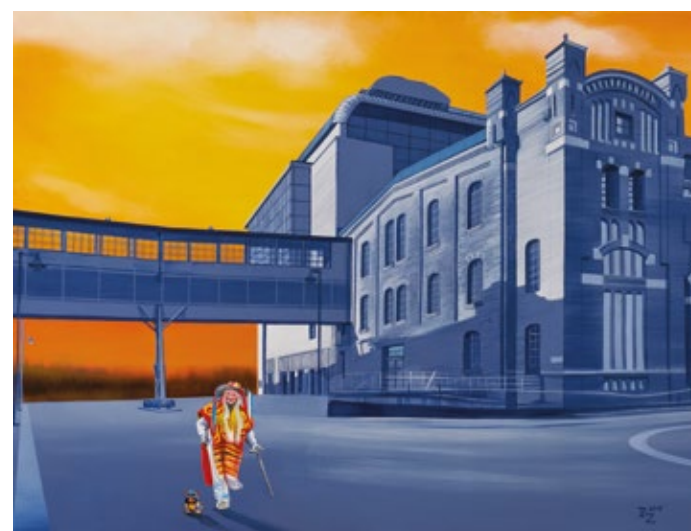
Marzec Paulina Zalewska EC1 z cyklu „Folk lokalny” - akryl, płótno, 60x80 cm