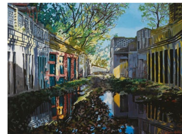
Kwiecień Izabela Gałązka Przedwiośnie przy Abramce - akryl, płótno, 60x80 cm