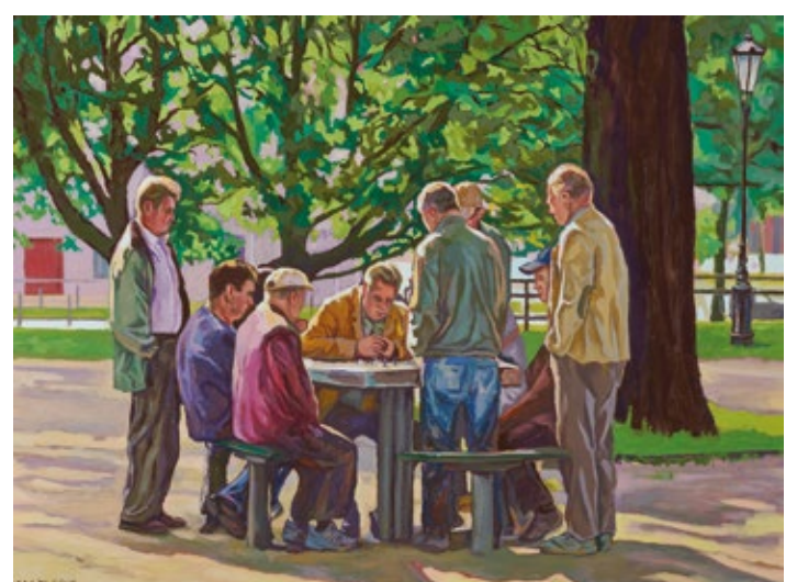
Maj Marcin Jaszczak Wiosenny pojedynek - olej, płótno, 60x80 cm