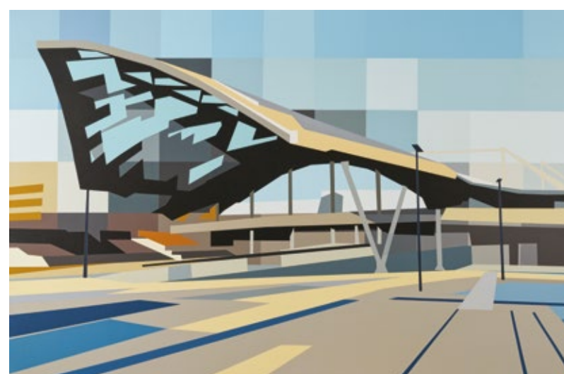
Czerwiec Jakub Napieraj Łódź Fabryczna - akryl, płótno, 80x120 cm