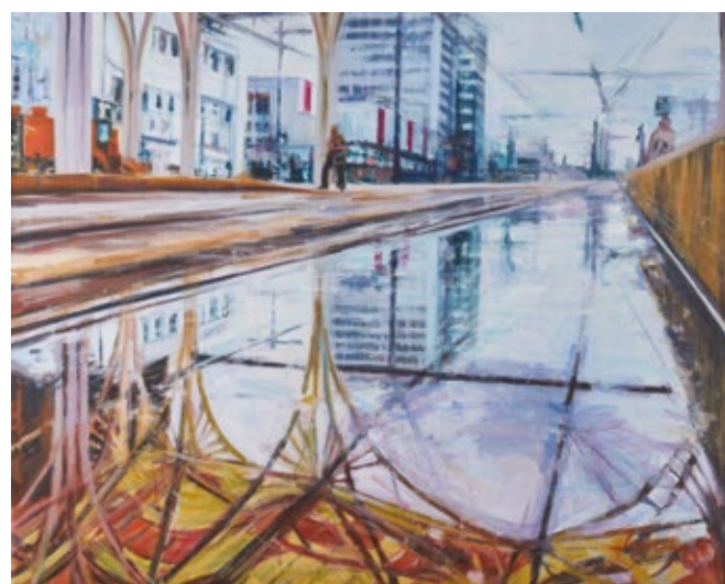
Luty Agnieszka Figurska Ciągłe pada - akryl, płótno, 80x100 cm